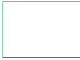
35 X 25 mm Laser