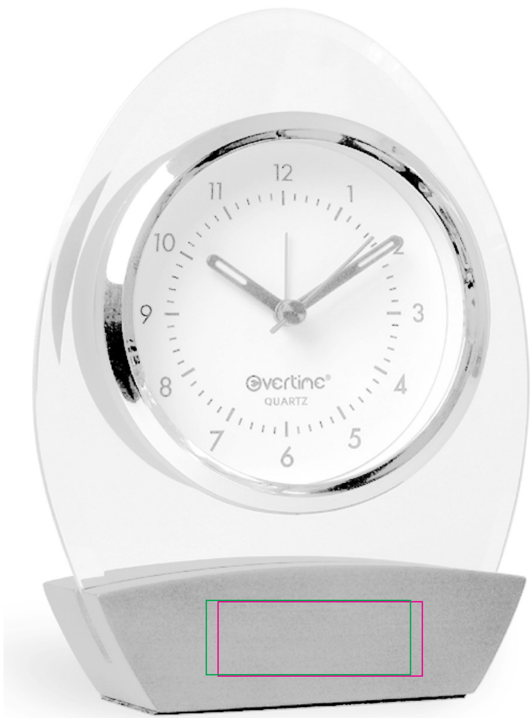
55 x 20 mm Tampographie / Padprinting / Tampografia / Tampografía