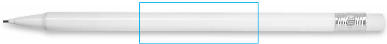
50 X 17 mm Sérigraphie / Silkscreening / Serigrafia / Serigrafía