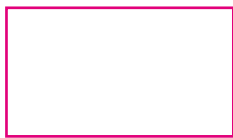
30 X 17 mm Tampographie / Padprinting / Tampografia / Tampografía