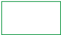
30 X 17 mm Laser