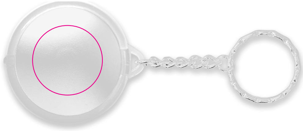
Ø 30 mm Tampographie / Padprinting / Tampografia / Tampografia