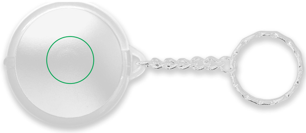
Ø 20 mm laser