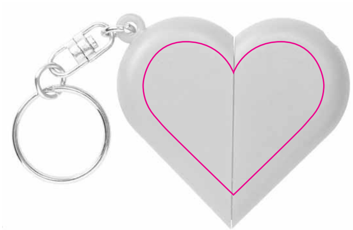
Tampographie / Padprinting / Tampografia / Tampografía