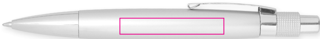
45 X 7 mm Tampographie / Padprinting / Tampografia / Tampografía