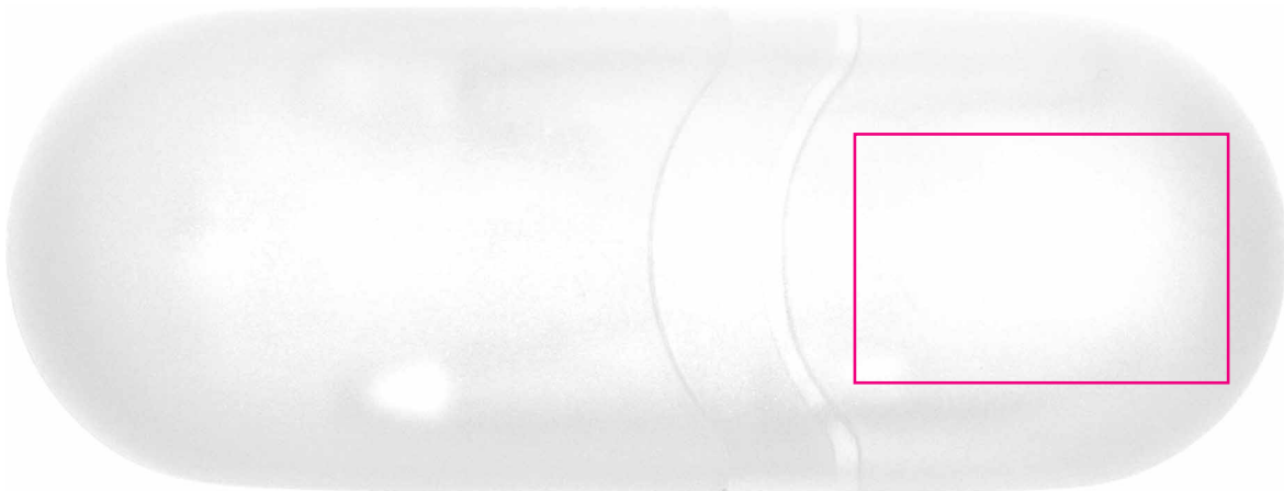
30 X 45 mm Tampographie / Padprinting / Tampografia / Tampografía