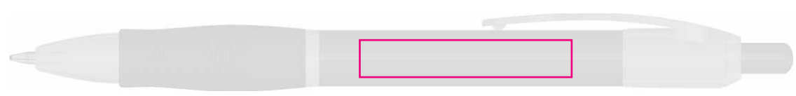
40 X 7 mm Tampographie / Padprinting / Tampografia / Tampografia