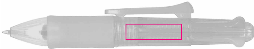
25 X 7 mm Tampographie / Padprinting / Tampografia / Tampografía