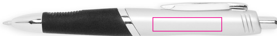
35 X 7 mm Tampographie / Padprinting / Tampografia / Tampografía